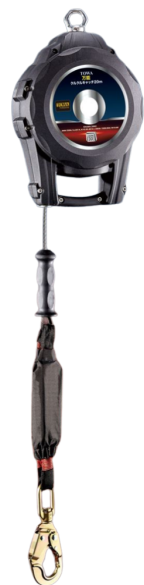
TOWA社 クルクルキャッチ (安全ブロック)